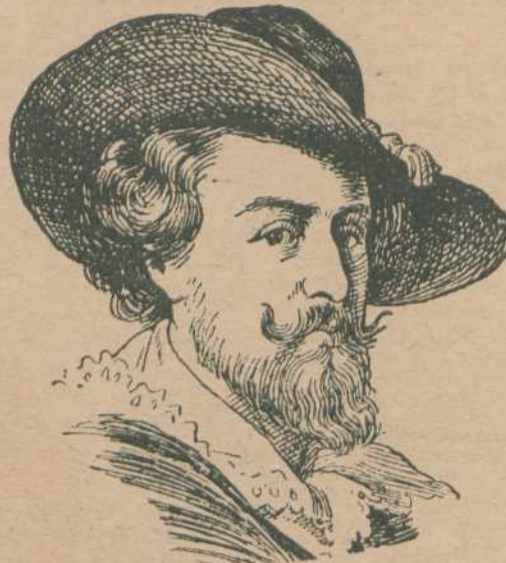
Pedro Pablo Rubens.

Conviene tener presente que de su primer matrimonio tuvo Rubens dos hijos varones, Alberto y Nicolás, y sólo una hija llamada Clara, que, según la autorizada opinión de Paul Mantz, no figura en ningún cuadro del maestro. En cuanto al segundo enlace, aun cuando de él quedaron cinco descendientes, dos de ellos pertenecen al sexo fuerte (Francisco y Pedro), de las tres muchachas que completan el número, las mayores, Clara, Juana e Isabel Elena apenas contaban ocho y siete años al fallecer el artista en 1640, y la más pequeña, Constanza Albertina, vino al mundo algunos meses después."