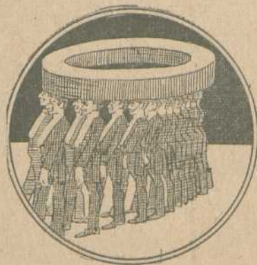
EL CHOQUE DEL 28 DE MAYO

Mas de quince bajo cero. Convierten la cámara en frigorífico.