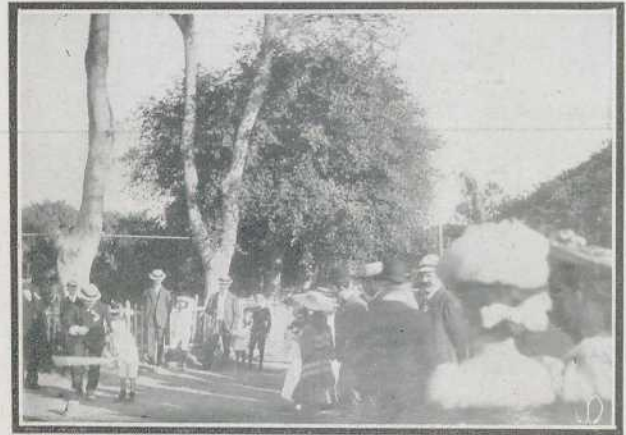
La fiesta alemana en Bellavista