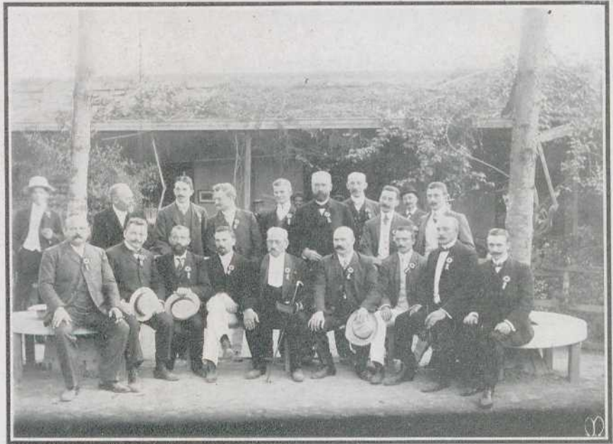
Personal del club filarmónico alemán