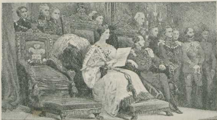
Victoria leyendo su primer discurso del trono, acompañada del Príncipe Alberto su esposo