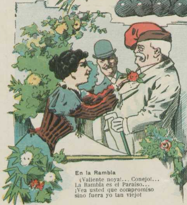
En la Rambla ¡Valiente noyal... Conejol... La Rambla es el Paraíso... ¡Vea usted que compromiso sino fuera yo tan viejol