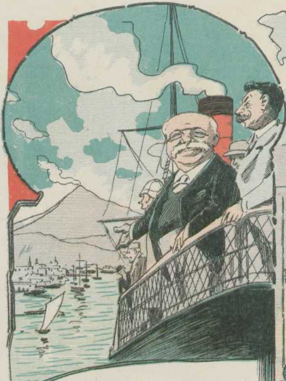
En las Palmas Jorje, ya vamos llegando, preven discursos y mimos; mira que á Europa venimos un empréstito buscando.