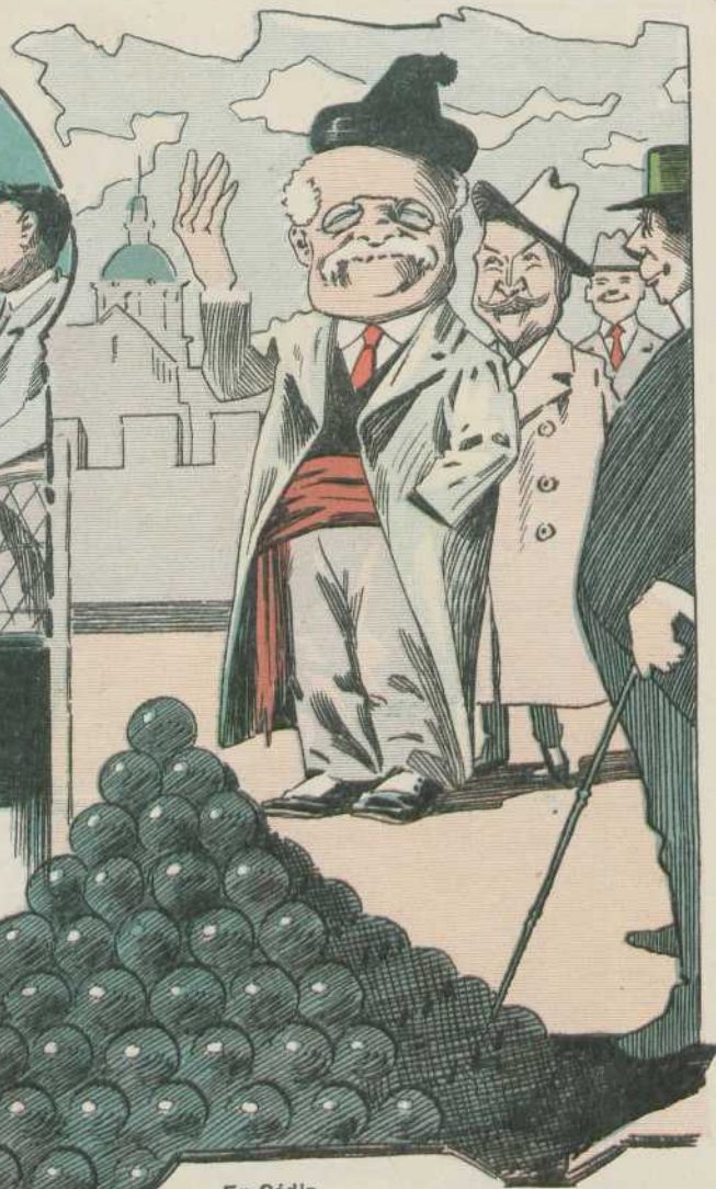
En Cádiz Balas ó bolas, ni en sueños me las trago. ¡Como no! Para bolas, las que yo he largado á los porteños.