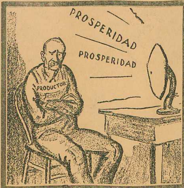
5 Esto es pura música celestial. (Del "New York World".)