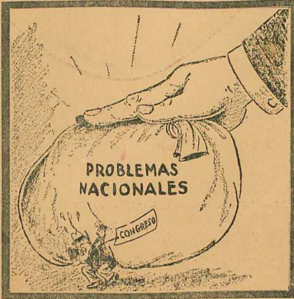
6 ¡Compartamos la carga!