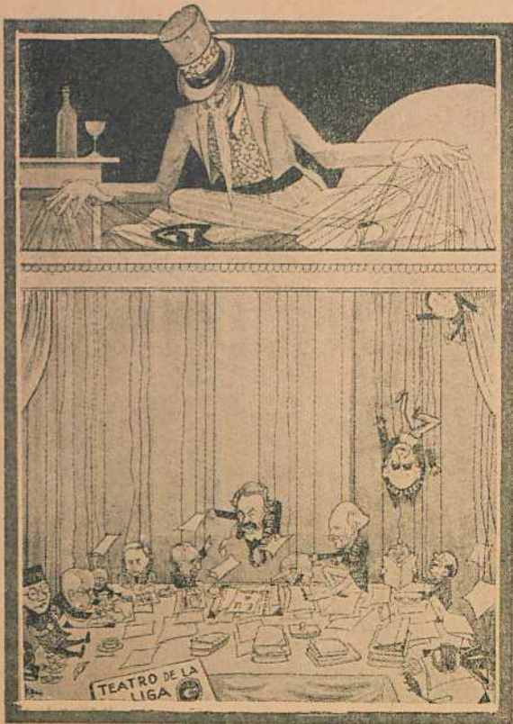
1 El que mueve los títeres. (De "The Bystander", Londres.)