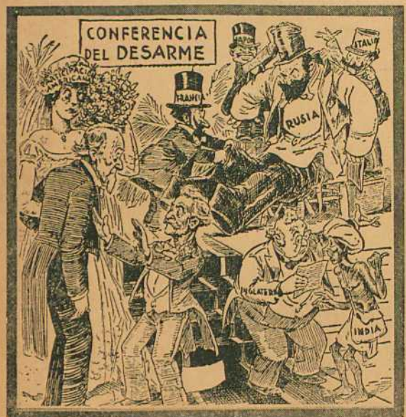
4 El novio no está bien preparado todavía. (Del "Dispatch", Columbus, E. U. A.)