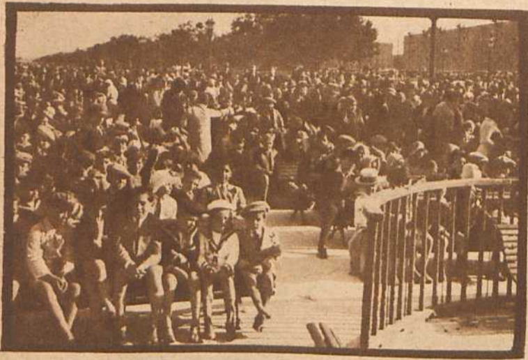
Los niños tuvieron su adecuada distracción con las representaciones del teatro infantil Labardén, cuyos intérpretes fueron muy aplaudidos por los pequeños espectadores.