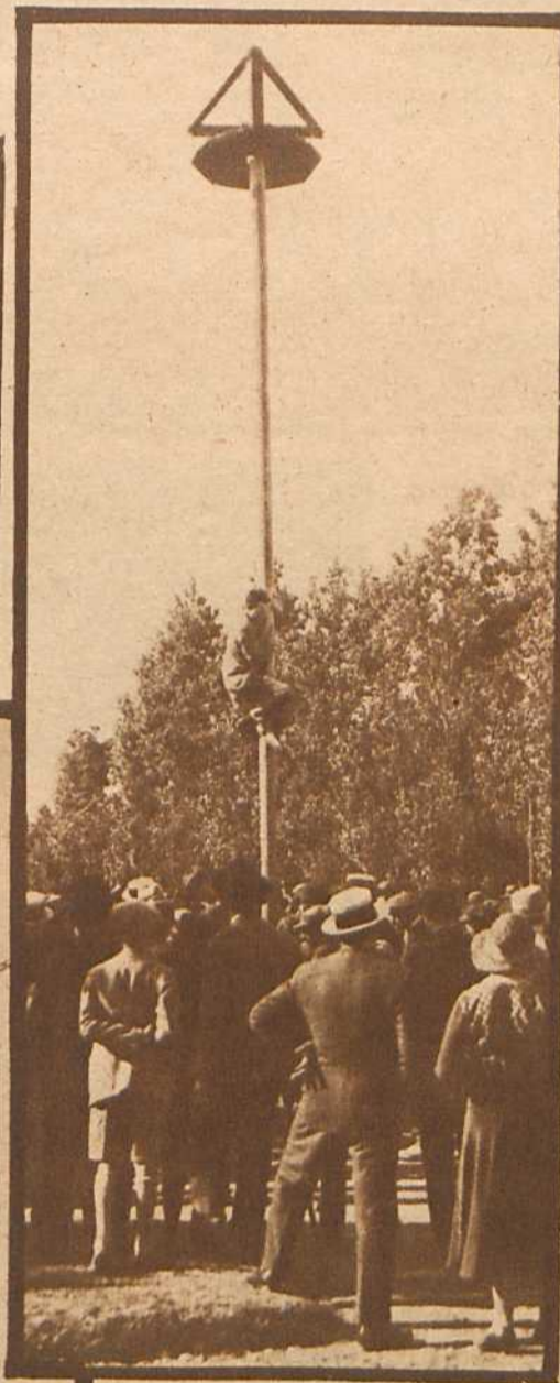
El palo jabonado también atrajo la atención del numeroso público que se había reunido para presenciar el desarrollo de los festejos en honor del patrono de Buenos Aires.