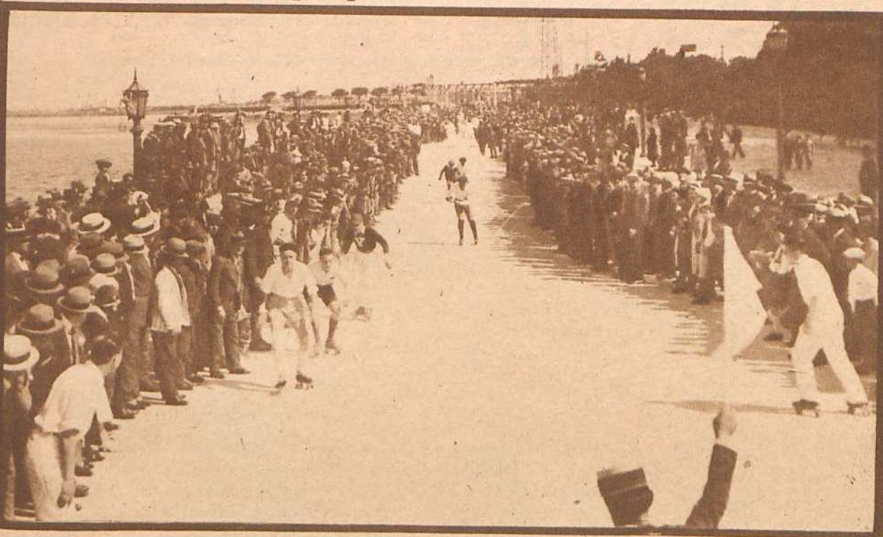
Celebrando el día de San Martín de Tours, se efectuaron en el Balneario Municipal grandes fiestas populares. Durante la realización de las carreras de patinadores, que fueron muy celebradas por el público.