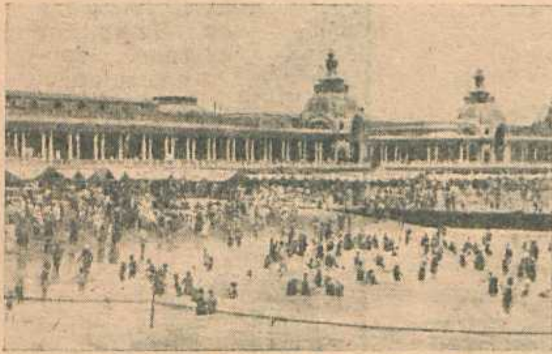
La plaza Bristol a la hora del baño.

● ● GRAFÓLOGO BARATO. — Según los grafólogos, la letra de padres e hijos tiene, a veces, también, un "aire de familia". Darwin — y conste que esta no es la opinión de un grafólogo, — en sus "Variaciones de los animales y de las plantas" escribió: "La escritura, ¿de cuántas combinaciones múltiples de conformaciones, de disposiciones mentales y de hábitos no depende? Y, sin embargo, ¿no se ve con frecuencia una gran semejanza entre las escrituras del padre y del hijo, aunque aquél no sea quien le haya enseñado a su hijo?"