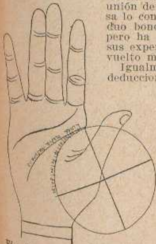
Fig. 51. Sistema Fludt de medir la Línea de la Vida

El principio de la Línea de la Cabeza suele ser casi siempre el mismo, si no se toma en consideración su mayor ó menor distancia de la Línea de la Vida; pero su extremo opuesto varía mucho, tomando tan pronto una, tan pronta otra dirección. Cuando alcanza el Monte de la Luna (fig. 57) anuncia idealismo ó imaginación viva, aunque moderada por esfuerzos de la voluntad; entrando en el referido Monte, revela al hombre fantástico, inconstante, informal, lleno de deseos románticos y afanado por aventuras excéntricas.