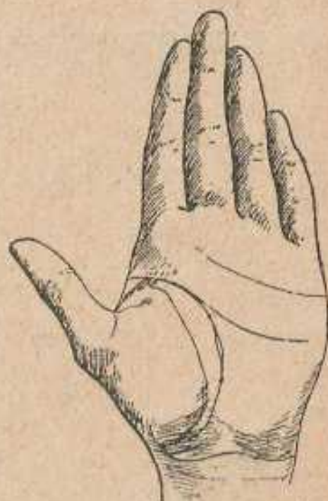
Fig. 55. Líneas de la Vida y Cabeza estrechamente unidas. Línea de la Vida doble con insulas, manchas y lunares.