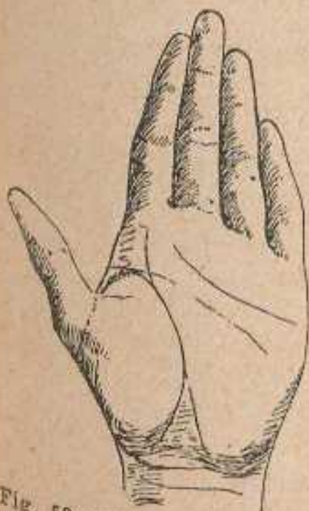
Fig. 53. Línea de la Vida con ramificaciones hacia Júpiter y bifurcación del extremo inferior.