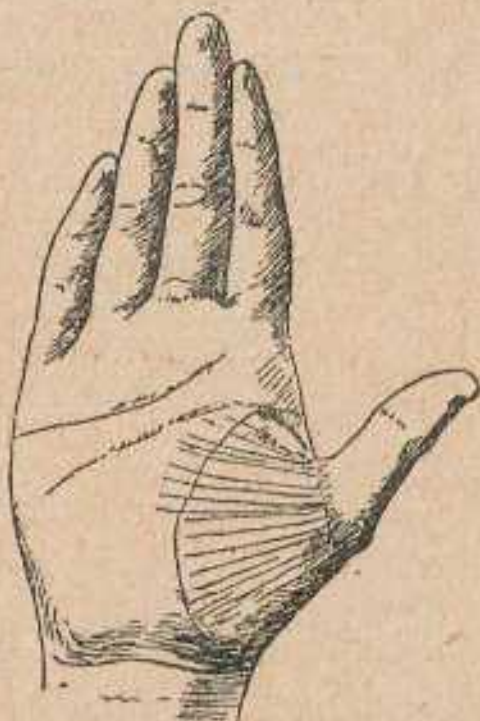
Fig. 54. Línea de la Vida atravesada por líneas transversales, salidas del Monte del Amor.