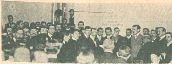
Comité de Monserrat