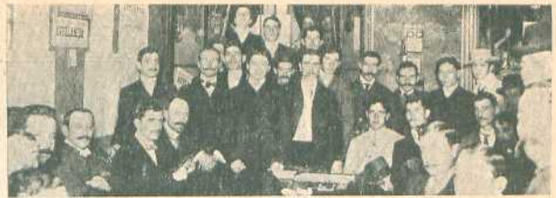
Comité Dios Patria y Libertad