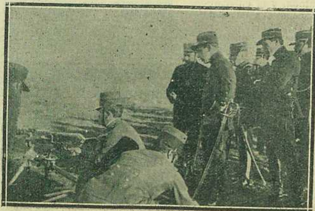
Observando la rapidez en los disparos

Para pasar el arroyo de Carrasco se hicieron experiencias con los puentes militares obtenidos en Dinamarca,