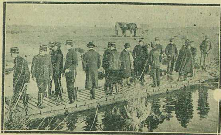
Jefes y oficiales sobre un puente