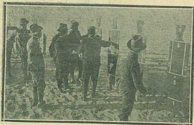
Observando los blancos hechos

Los fusiles automaticos «Maxim», mostraron su eficacia como aparatos de concentración de fuegos. Vienen á ser, como ametralladoras portátiles y la cantidad de proyectiles que ar-