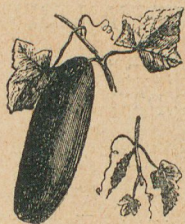
Cohombro de cornichón ó pepinillo

Entre las coles que se aprecian por su flor, que se come, están el repollo y la col de Bruselas. En los repollos también las hojas se consumen.