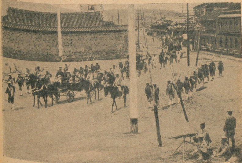
El golpe de estado de Seúl.—El marqués Ito, residente general del Japón, al ir bajo la protección de las ametralladoras, á asistir á la coronación del nuevo soberano.