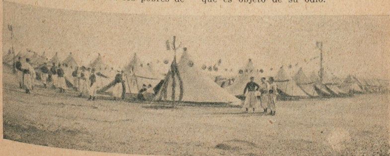
El adorno del campamento para la fiesta patria

Conocidos son los destrozos que causaron en las obras del puerto, empresa que es objeto de su odio.