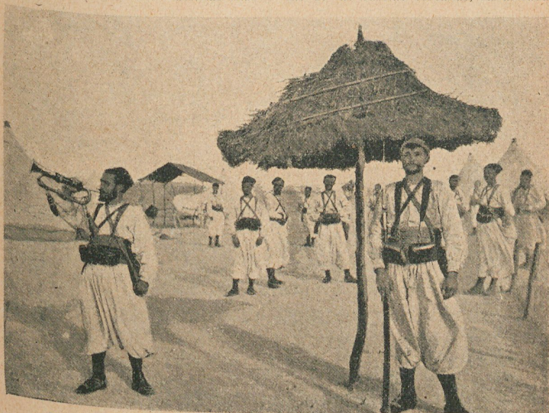
Campamento de la columna de ocupación.—Una garita africana

Todo marchaba perfectamente, cuando el 30 de Julio aparecieron las fuerzas de las kabilas cercanas, fanatizadas