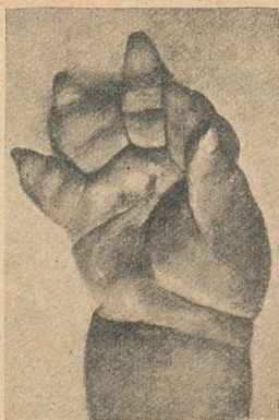
Tipo de la mano llamada "pie de elefante"

irregular, es muy frecuente: esta anomalía se observa en Soleilland, el asesino de la niña Marta Erbeling, recientemente indultado de la pena de muerte. También es común el mechón blanco caprichosamente colocado entre el cabello. Sila, el célebre dictador romano, tenía esa marca y por ello comparó un poeta atenlense su cabellera á un muro rojizo salpicado de yeso. Tal vez esas burlas contribuyeron á que derramara cruelmente la sangre de sus enemigos políticos. Abundan también entre los identificados de ambos sexos los que presentan extrañas jorobas, algunas tan irregulares como las del "Lagardère de Charonne" y el "Dromedario de la Butte - aux - Cailles". Citemos, además, los hormafroditas y ginecomastas ú