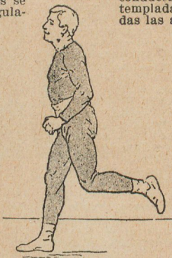
La carrera (aire moderado)