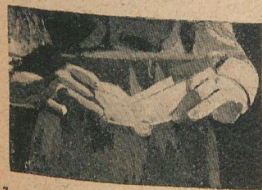
1. Pasando una moneda de dos centavos por una abertura de una de un centavo.

Un corresponsal alemán nos ha enviado una serie de fotografías—que aquí publicamos—de algunos trucs sencillos, con las instrucciones para ejecutarlos.