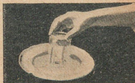
2. Rayos que se parten en el agua, viéndose dos monedas donde sólo hay una.

2. Intercepción de rayos en el agua. —Colóquese un centavo en un vaso de agua, hasta un tercio de su capacidad. Colóquese un plato encima del vaso y en seguida, vuélquense ambos rápidamente; mirando dentro