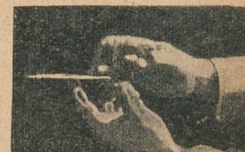
4. Truc con una moneda

6. Los maniqués danzantes. —Tómese una lámina de vidrio sensible