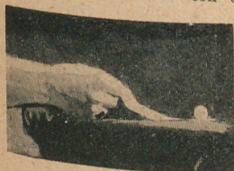
5. La moneda firme

7. Hacer caminar una moneda. —Colóquese la moneda entre dos tenedores sobre una mesa cubierta y encima un vaso. Para sacar la moneda sin tocar los tenedores ni el vaso, se rasca la carpeta de la mesa y la moneda comenzará a caminar. 8. Equilibrio de dos monedas. —Esto se puede hacer solamente con un engaño.