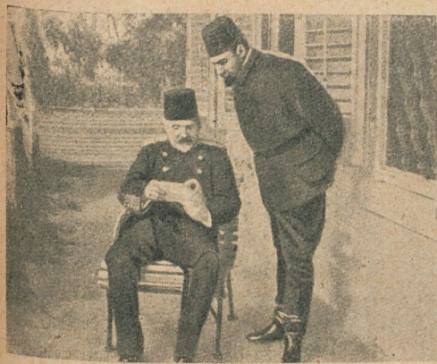
El general De Giorgis en su villa de Salónica