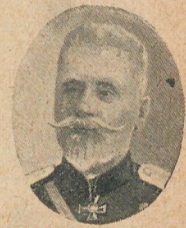
El general Smirnov, del ejército ruso

—Entre Londres y Leicester, cerca de Wembley, se rompió el eje del ténder de