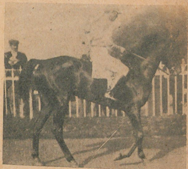
Minera, ganadora del premio "Pas-si-Bete", 1.200 metros

clase debe siempre imponerse, aun cuando ella sea en posición favorable á a adversaria. Después de su figuración en el premio "Ignacio Correas", en el que cayó vencida por Proserpine á escasa diferencia en uno de los mejores tiempos de 1.400 metros, su triunfo se impone, pues sus adversarias no poseen la