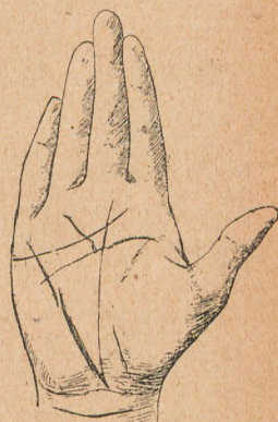
Fig. 68. El triángulo pequeño

más ó menos paralela ratifica aún lo dicho. Y por último el Brazalete (fig. 66). Consiste éste en líneas que enlazan la muñeca á guisa de brazaletes, la "diademas medievales" como llamaban los quirománticos cuando reunía todas las condiciones características. Tres son las líneas que lo forman y que son presagio de vida larga y buena salud. Cada uno de estos anillos cuenta por treinta años; puede, por lo tanto, darse por muy satisfecho el que lo menos, y contará sus sesenta por propia satisfacción, caso de formar las líneas como una cadeneta. Actividad en progreso, reposo es retroceso. Sólo el momento nos hace sentir el encanto de nuestra existencia, y por lo tanto es más provechosa la vida de aquel que es activo