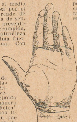
Fig. 66. El Brazalete, cruces, triángulos, Línea del Genio.

¿Y qué significa cuando la "Vía láctea" atraviesa el Monte de la Luna? Pues un santo ó una santa. El amor completo se cifra del todo en lo metafísico. Existe entonces una afinidad muy es-