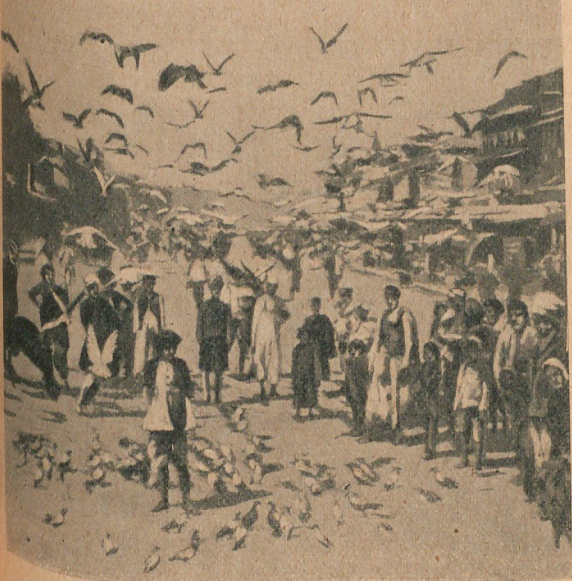
Los animales, ya satisfechos, manifiestan su alegría

BENARÉS Y SUS CUATRO MIL TEMPLOS.—Benarés, la villa santa entre to-