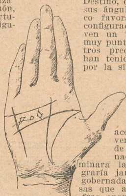
Fig. 69. La Mesa de Mano