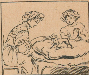
El perro fué amansado por el hombre para velar por él; sin embargo, pagamos el más alto precio por el menos capaz de prestar tal servicio.