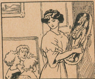
Y hasta los juguetes, que se idearon para entretener á los niños, cuando son muy lindos y caros, se guardan, no sirven para maldita la cosa.