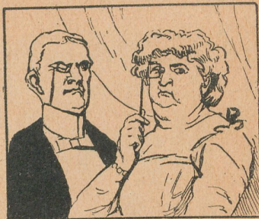
Unos lentes que permiten ver es cosa vulgar. El monóculo y el impertinente, que no sirven tan bien para el objeto, tienen un precio mayor.