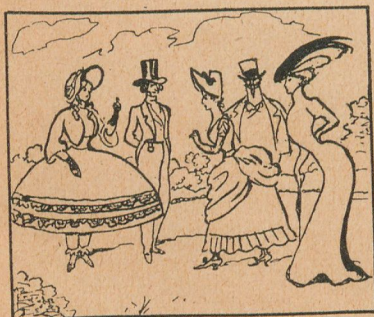
El hombre confeccionó el vestido para preservarse de la intemperie; no obstante lo cual las "toilettes" más costosas son aquellas en que menos se tiene en cuenta la cuestión.