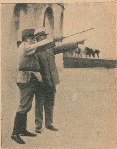
El general Marina en el fuerte Camellos, dando instrucciones para comenzar el ataque.