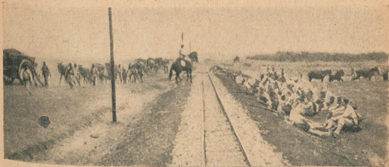
Convoy de provisiones para los fortines, protegido por la infantería