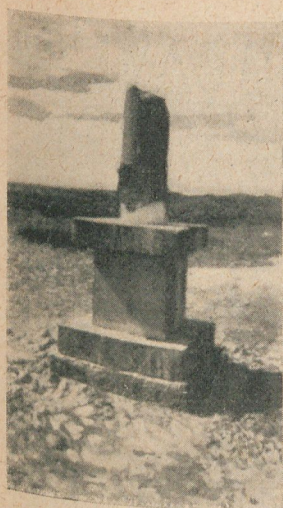
Cipo ó piedra miliaria que indica el sitio en que fué muerto el capitán Loubet, cerca de Settat.

tributado un homenaje más solemne y duradero elevando, sobre el suelo mismo en que cayeron, monumentos que perpetúan su memoria.