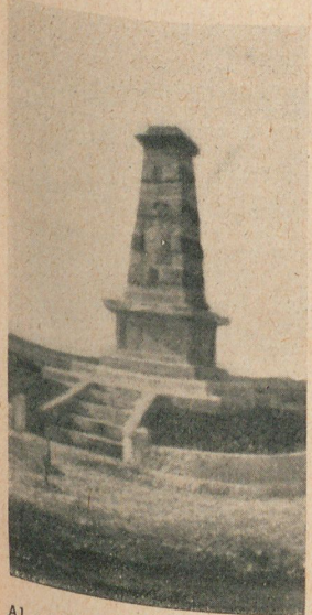
Al oeste del collado de Settat, sobre las alturas de Ber-Rechid.

El monumento de Sidi-Djebli fué inaugurado el 1.º de junio con una ceremonia exclusivamente militar, una simple revista de la guarnición de Settat que, en seguida, desfiló ante el túmulo. Estos monumentos carecen de importancia arquitectónica, como se observa con sólo pasar la vista por sus fotografías; pero en cambio tienen una significación moral muy grande: porque simbolizan un noble sentimiento de compañerismo y de amor á la patria.