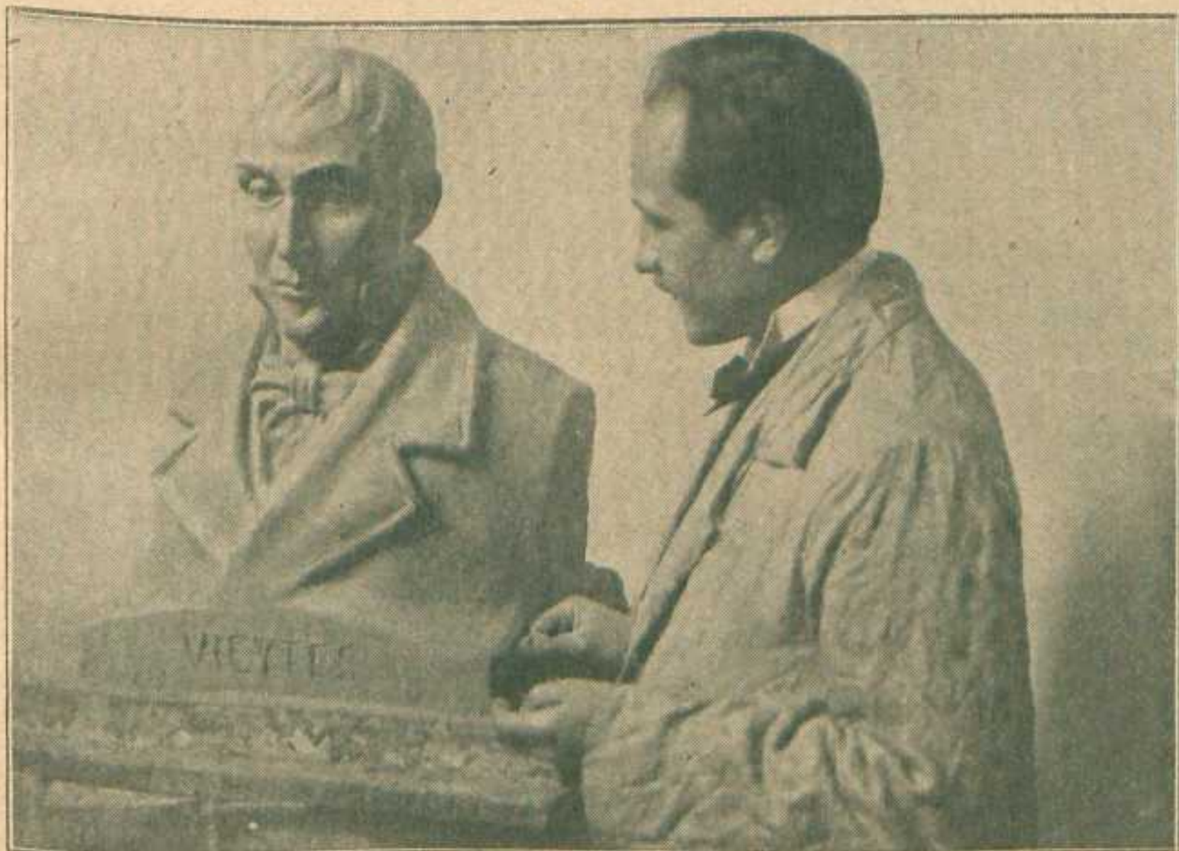
Estatua de Vieytes, modelada por el escultor señor Luis Perloti, que próximamente será inaugurada frente al Ministerio de Agricultura, en la confluencia de las calles Azopardo y Carlos Calvo.