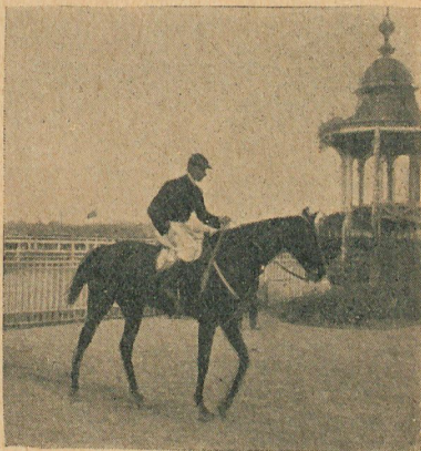
Barzac, premio "Nebulosa"

No nos extenderemos en otros comentarios para las demás carreras de campo-