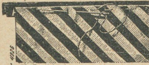
53. Modo de hilvanar un vivo