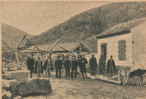
Barricada levantada por los habitantes de Nemours á la noticia de la aproximación de los Beni-Snassen.

En la frontera argelino-marroquí se efectuaron los preparativos militares para castigar por su agresión á los Beni-Snassen. Un pequeño convoy enviado el 2 de diciembre de Sidi-Bu-Djenan á Martimprey, fué atacado en Bab-el-Assa, y su conductor, Doucet, cayó á los tiros