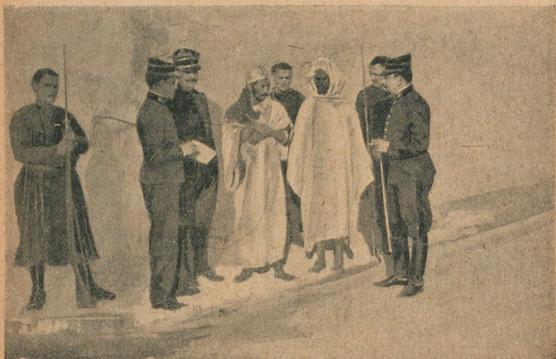
Interrogatorio de dos Beni-Snassen, tomado por los oficiales de la oficina árabe de Marnia