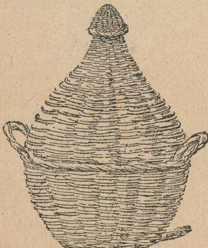
Aspecto exterior de la damajuana

En Játiva (España), se ha descubierto un ingenioso procedimiento de fraude, utilizado para el contrabando de alcohol.