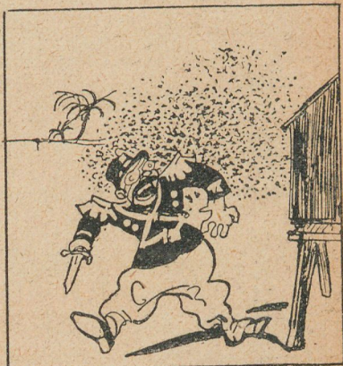
FRANCIA EN MARRUECOS —Pican, pican los moritos y, además, piden plata.