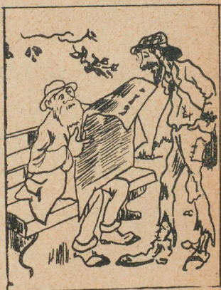
(Leyendo). —“Continúase hablando de la guerra probable del Pacífico, que sería terrible.” —La verdad es que cuando un pacífico ensilla el picaso!