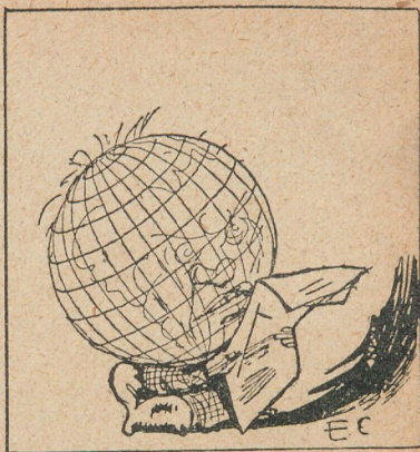
EL "RAID" NUEVA YORK-PARIS La Tierra. —Primero la carrera Pekín-París; ahora esto. Estoy ya cansada de que me tomen para reclamo.