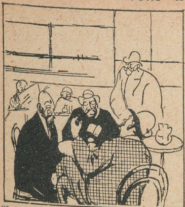
EL LIBRO BLANCO SOBRE LA CONFERENCIA DE LA PAZ —¿Pero, por qué lo llamará el gobierno alemán libro blanco? —Porque, siendo blanco, todo lo que contenga se verá muy negro.