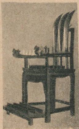
El sillón de los ruegos, suplicio chino

La carne del cuerpo falta, pero, en cambio, hay mucha piel.