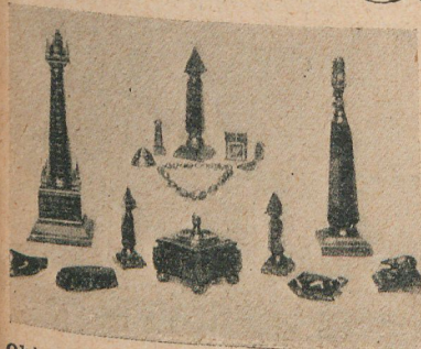
Objetos de adorno, de carbón, hechos por un minero del condado de Derby

OBJETOS DE CARBÓN TALLADO. —El maquinista de una mina del condado de Derby (Inglaterra), dedicó sus ratos de ocio durante muchos años á construir objetos de adorno de carbón antracita. Esta afición le exigía mucha paciente labor y gran habilidad. En la fotografía se ve un trozo del carbón con que se hicieron los objetos representados.