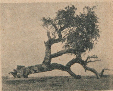
Vitalidad de un árbol

EL SILLÓN CHINO DE LOS RUEGOS. —Este sillón es un