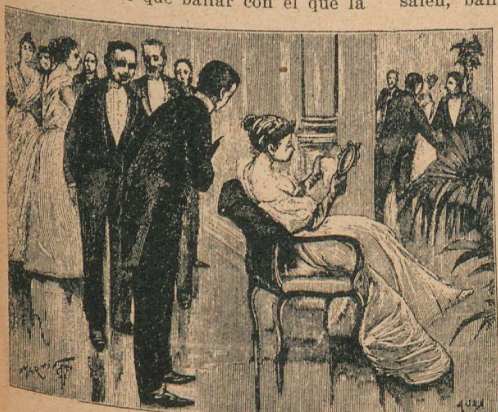
Una figura del cotillón: el espejo

El cojín . Una dama está sentada en medio del salón, y ante ella hay un cojín donde apoya el pie. Los caballeros van presentándose y tratando de poner en él una rodilla; pero la dama los aparta con el pie hasta que llega el de su elección; entonces le deja arrodillar, se levanta y baila con él.