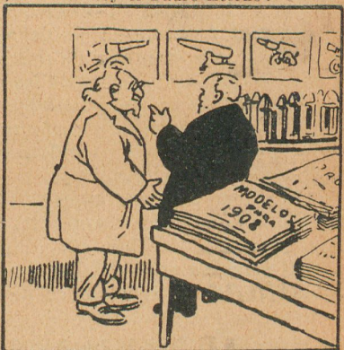
Los últimos inventos

—Ahora se ha inventado el cañón que dispara sin ruido.