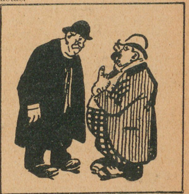
El "raid" de los automóviles

—Es el colmo: ¡un ferrocarril que amenaza con desastres aun antes de estar construido!