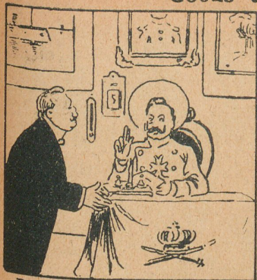
Después de la carta de Guillermo sobre la marina

—Bülow, ¿puedo echar al buzón una tarjeta postal para un amigo?