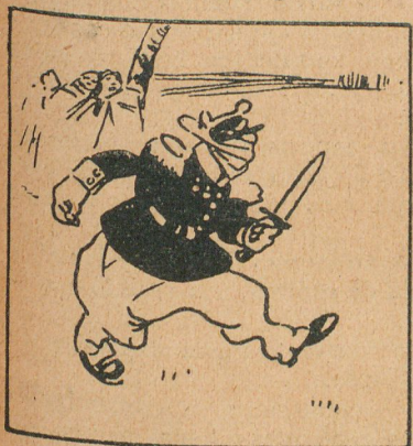
Francia en Marruecos

—Hombre, me choca la pregunta. ¿Acaso no soy el Padre Eterno?