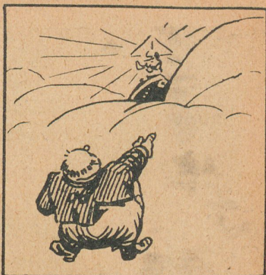
Guillermo é Inglaterra

—Bülow, ¿puedo echar al buzón una tarjeta postal para un amigo?