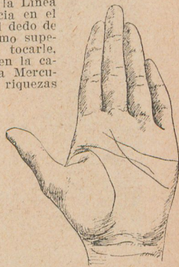
Fig. 46. La Línea del Destino nace en el Monte de Marte

to en que está atravesada por la Línea de la Salud—línea que se dirige hacia Mercurio, arrancando de la Línea de la Vida—marca los veinticinco, el punto de cruce con la Línea de la Cabeza, los cincuenta; el del cruce con la Línea del Corazón, los setenta y cinco años. Caso de continuar la línea más allá de la últimamente nombrada, hay motivo para esperar sucesos extraordinarios, hasta en una edad muy avanzada. Terminando la línea