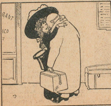
Vista por delante.