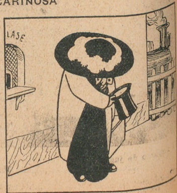
Vista por detrás.