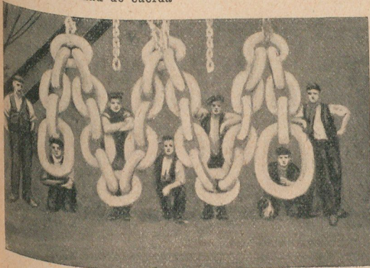
La cadena de hierro mayor que se ha construido en Inglaterra

Una pila seca, que cuesta un chelín, pone las manecillas en movimiento por contacto directo con la corriente eléctrica.