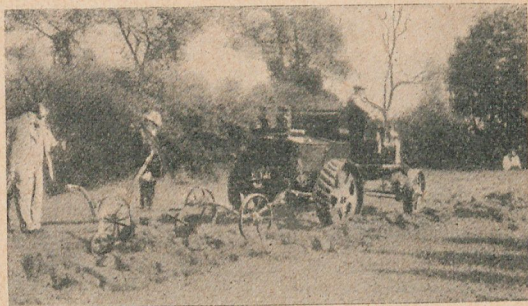
Automóvil que sirve para la tracción, como trilladora, arado y máquina contra incendios