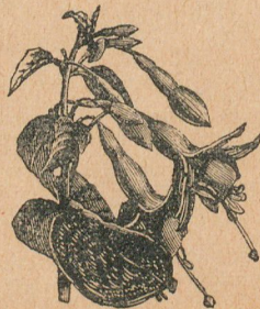
Fucsia (ramo florido)

FUEGO GRIEGO. —Mezcla inceda- ria inventada en Oriente é in- troducida en Europa durante el si- glo VII. Estaba formada por sub- stancias grasas y resinosas, azufre, jugos de ciertas plantas y metales