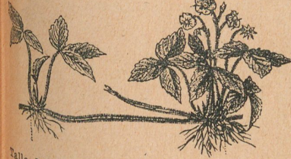
Planta de fresa

FUEGOS FATUOS. —El cerebro y los nervios