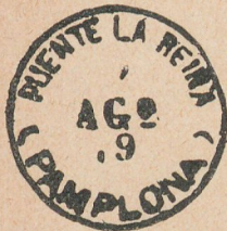
Núm. 6. Matasellos usados en 1879

En la Fábrica del Timbre las emisiones se preparan grabando planchas que contienen cien reproducciones del original. La estampación se realiza en una máquina complicadísima, verificándose con extraordinaria precisión la toma de tinta en los rodillos, la graduación de su