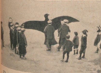
El águila-plano preparado para la ascensión

EL FAROL DE LOS HUESOS DE BALLENA. —Este farol se en- cuentra en Rothwell, cerca de Leeds (In- glaterra), y los ma- xilares de ballena que lo soportan tien- en una altura de tres metros y medio. Reemplazan, conser- vando una tradición,