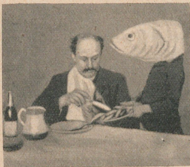
En el banquete de un club de pescadores de caña

BANQUETE EXTRA- ORDINARIO. — Un club de pescadores de ca- ña existente en Al- burgh (Suffolk, In- glaterra), da anual- mente un gran ban- quete, en el que sólo se come pescado. Es- te es servido por unos muchachos que llevan puesta una ca- beza de pez, de car- nón.