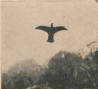
El águila-plano en el aire

á otros dos huesos de ballena que desde hacia mucho tiempo sostenían también un farol en el cami- no de la iglesia de Rothwell. Una vez más, el amor á lo tradicional, tan vivo en Europa, y en In- glaterra especialmen- te, mantuvo un obje- to extraño.