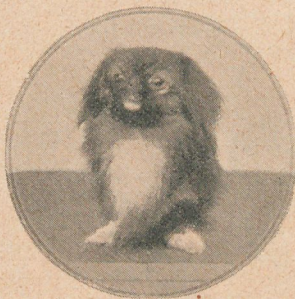
Perrito por el cual se ha rechazado una oferta de 25.000 pesos oro

AGUA FILTRADA PARA EL PÚBLICO. — La apli-