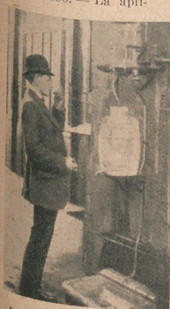
Agua filtrada en una calle de París

EL AUXETOCELO. — El honorable Charles Pearson ha inventado un mecanismo, por medio del cual se utiliza el aire comprimido para reforzar el tono del instrumento al que se adapta. Consiste en una es-