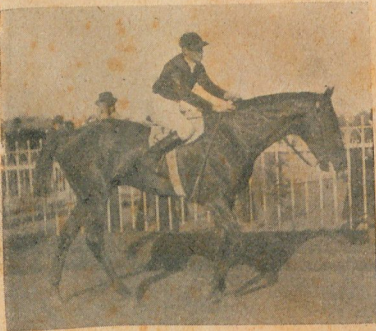
Cerrito, ganador del clásico "Rivadavia", 2.000 metros

Se anuncian como probables competidores siete de los anotados, de los cuales