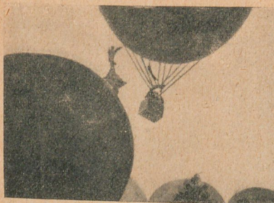
El "Cosmos" llevando cuatro pasajeros, se desgarró con el ala de una estatua de "La Victoria".