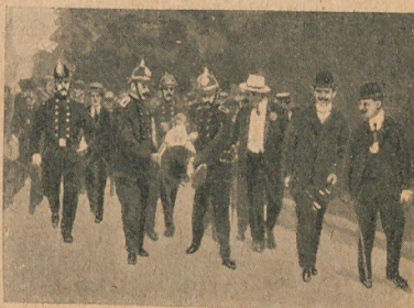
Transporte de las víctimas del accidente al puesto de socorros á fin de reanimarlas con oxígeno.