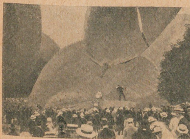
La barquilla del "Cosmos" traída á tierra, donde se sacaron las dos víctimas

y no sufrieron nada; pero los otros dos quedaron medio asfixiados, en un estado que inspiraba gran inquietud, y sólo el rápido auxilio que se les prestó hizo que el accidente no tuviera un resultado fatal.