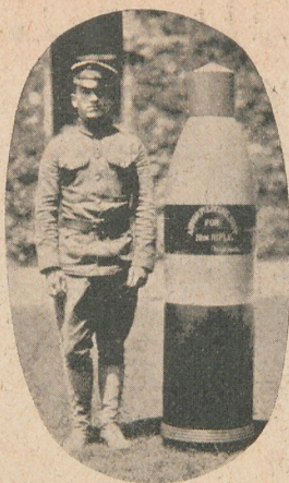
Proyectil que pesa 2.400 libras y puede ser lanzado á distancia de 20 millas.

gadas usados en la escuadra británica tienen también gran potencia, siendo su alcance extremo de 25 millas, por más que sólo se apunta á las 15 millas, para obtener resultados prácticos.