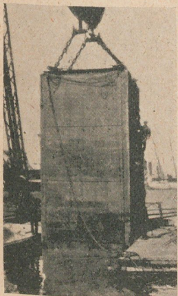
Probando un torpedo contra una sección de acorazado norteamericano. El blanco flotante acorazado antes de lanzarse el torpedo.

Otra fotografía muestra un blanco—que representa la sección de un acorazado moderno norteamericano—poco antes de ser llevado á Sandy Hook, para probar en él el efecto producido por el torpedo.