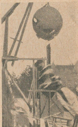
Y lo eleva hasta la altura de un cuarto piso

En cuanto á las figuras decorativas que representan las cinco partes del mundo, si para elevarlas en las nubes de bronce han tenido, como la esfera, que recurrir á los buenos oficios de la grúa, ellas se han lanzado, sin embargo, con bastante gracia para formar alrededor del globo su ronda simbólica. Dentro de poco los obreros afinarán los detalles de la obra que no ha sido aún sino esbozada, y después el escultor Saint Marceaux examinará el conjunto de la obra para corregir, si es posible, las últimas pequeñas imperfecciones.