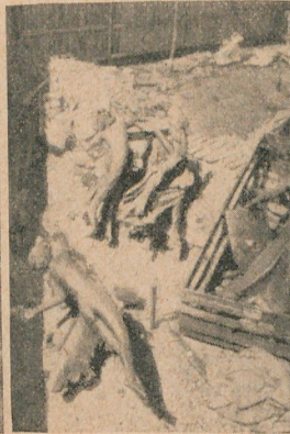
Cuatro de las figuras: la villa de Berna, la Europa, la Oceanía y la América.