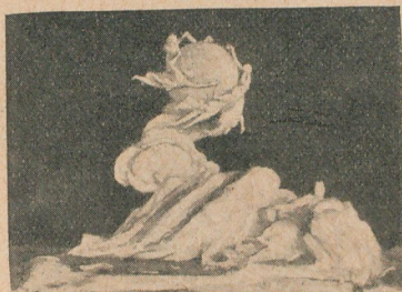
Vista de conjunto del monumento, según la maquette