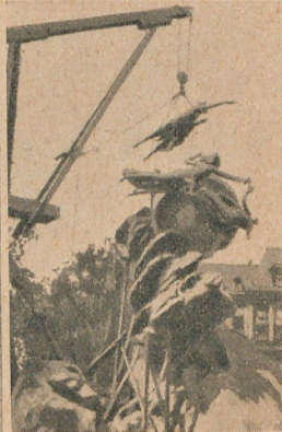
Posición de las cinco partes del mundo alrededor de la esfera.