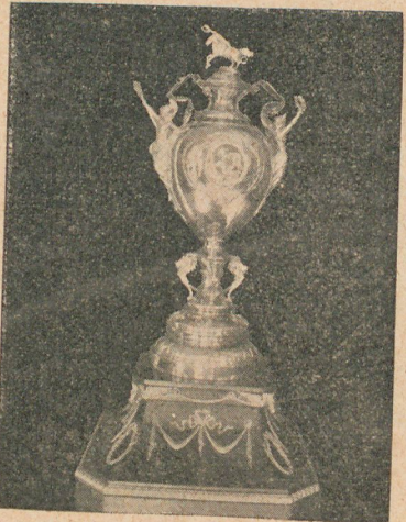
La copa de Honor

cha y el empuje que lleva siempre su avance de última hora.