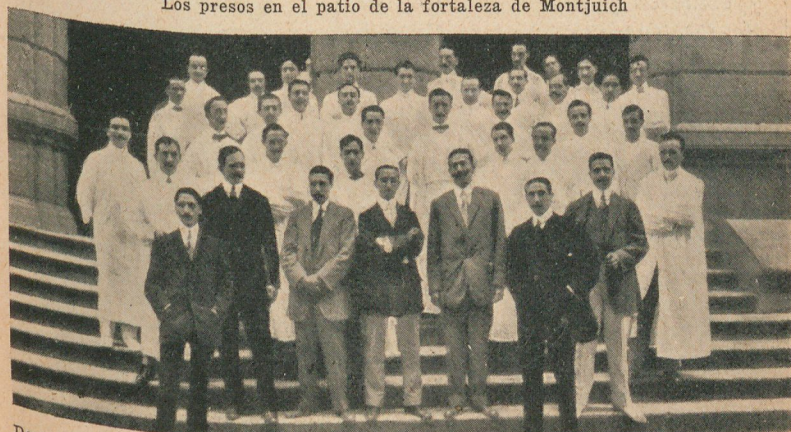
Doctores y practicantes del Hospital Clínico de Barcelona, que durante ocho días y ocho noches consecutivas, estuvieron prestando servicios á los heridos