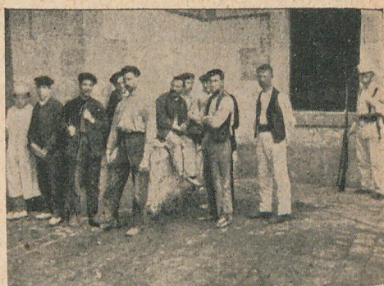
Los presos en el patio de la fortaleza de Montjuich