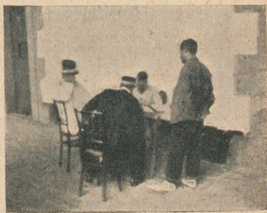
Primeros interrogatorios por los capitanes instructores