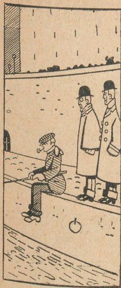
Primer espectador. — Ha agarrado un pez grande.