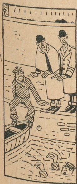
Primer espectador. — Déjase, marinero; no vaya á sacar á ese hombre; hay de por medio una apuesta.