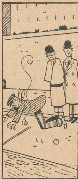
Segundo espectador. — Tan grande, que se lo lleva.