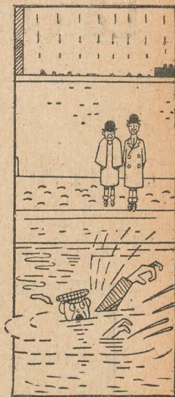
Primer espectador. — Apuesto cinco libras á que se ahoga. Segundo. — Van.