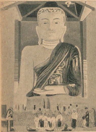
El Gaudama Buda, del monasterio de Majori, á una legua de Rangoon, del que son muy devotas las birmanas, muchas de las cuales se cortan el cabello y lo cuelgan delante de la imagen ó en las columnas próximas.