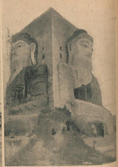
El Kyakpun, de Pegu, de 90 metros de altura, que fué construído por los cambodgianos hace mil años. Representa los cuatro grandes Budas que aparecieron en varios tiempos: Kankathan, Gaunnaghon, Karhapa y Gaudama.