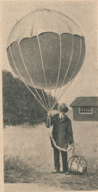
Globo sonda de Assmann

¿Cómo llegar á esas regiones inabordables para el hombre y en las que se desarrollan los principales fenómenos meteorológicos que más interesan? Sólo medios impresionables, observaciones registradas automáticamente y otras más especiales podían informarnos con respecto á lo que pasaba sobre ese nivel superior, conocido solamente en sus perturbaciones (nubes, corrientes, temperatura, etc.); observaciones efectuadas ya en la superficie del suelo ó en las cimas elevadas. Aparte de estos estudios, no quedaba más remedio que formular concepciones teóricas; hasta la época, relativamente reciente, en